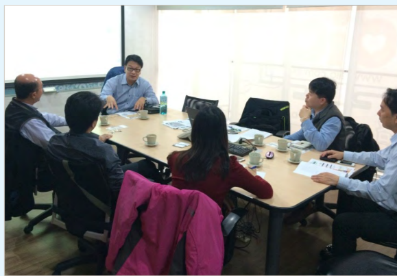
本案合作之技轉單位 財團法人印刷工業技術研究中心